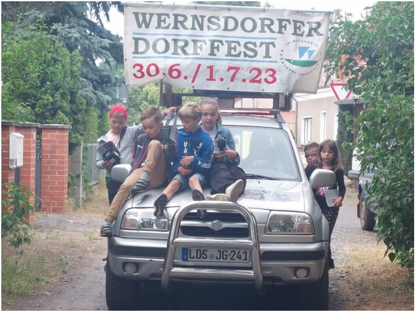
Zamperkinder am 17. Juni in Wernsdorf