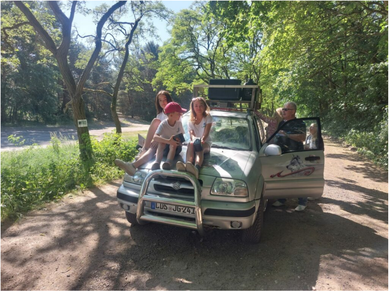
Kurz vor dem Start nach Ziegenhals zum Zampern am 3. Juni 2023