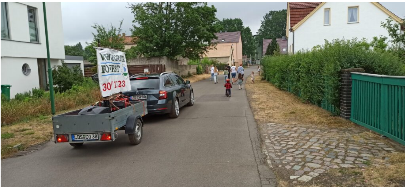
Zampern in Wernsdorf am 17. Juni 2023