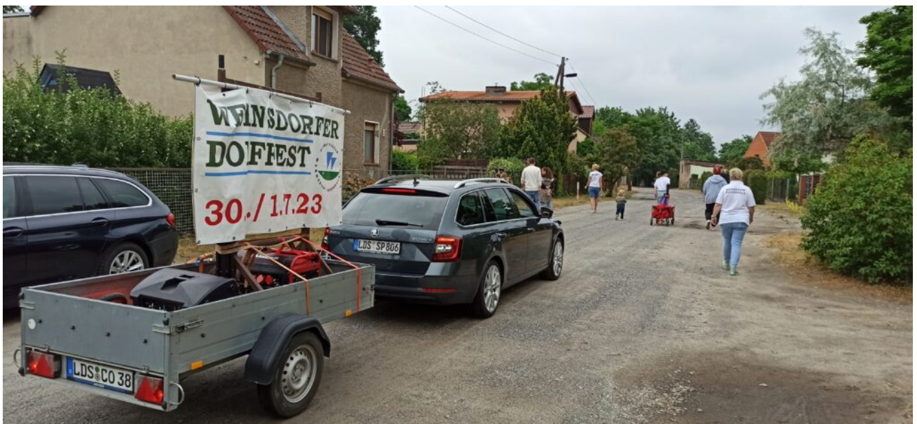
Beim Zampern am 17.06.23 in Wernsdorf