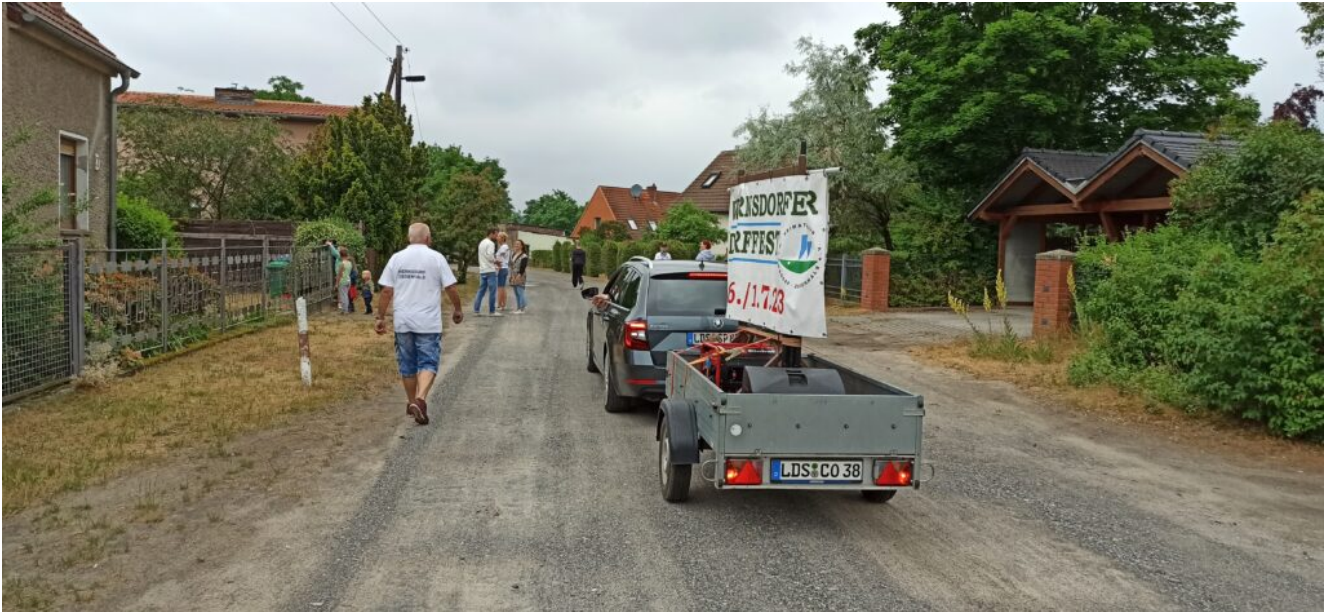
Am 17. Juni 2023 unterwegs durch Wernsdorf