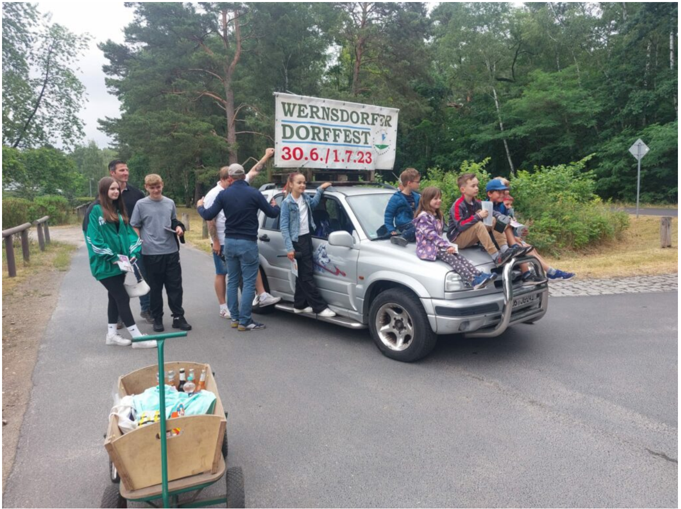
keine Chance – die Zamperkinder on tour in Wernsdorf